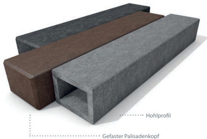
■ Grau ■ Braun ■ Schwarz